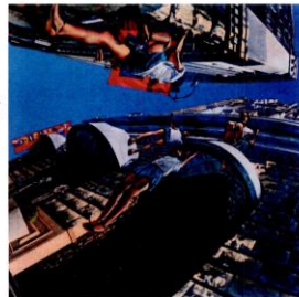
2012 あなたの行き先はどこか、II 100S