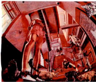
2017 注文の多いパティック 130F