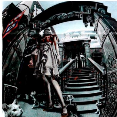
2018 注文の多いパティック 寺院前 100S