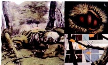
2017 新展 150P